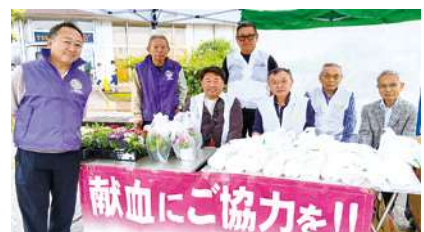
午前中参加者 (一部)