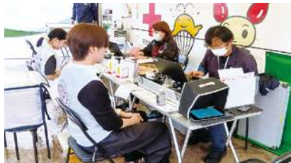
学生ボランティアの方も献血

尚、取材撮影頂いたテレビ和歌山の夕刻のニュースにて献血活動の様子が放映されました。