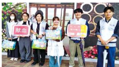
学生ボランティア (一部)