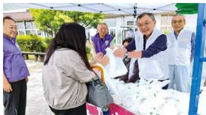
善意の方々に粗品進呈!!