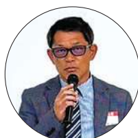
部門別協議会で挨拶の東徹地区公共イメージ委員長