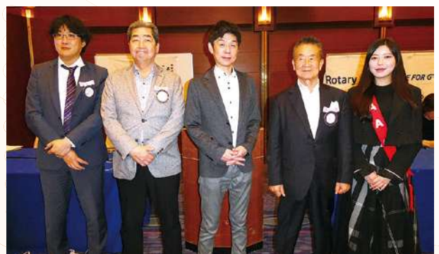
4月誕生日の会員さん